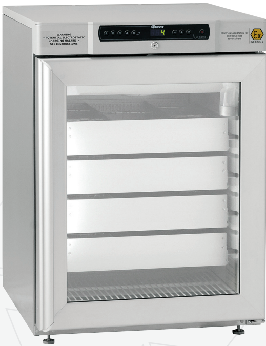
BioCompact II RR210. Schubladen und Glastür stehen als optionales Zubehör zur Verfügung.

Neben der konstanten Temperaturhomogenität bietet das Kältesystem mit einer effektiveren Abkühlung nach Türöffnung und der Vermeidung von Rückwandkälte weitere Vorteile gegenüber herkömmlichen Verdampfersystemen.